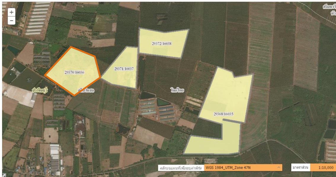
พื้นที่คำขอประทานบัตรที่ 1/2552